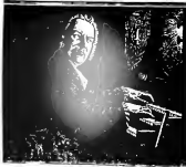
Joh. Seb. Bach